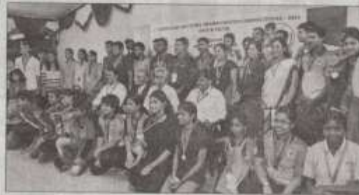
PRIDE OF MADURAI: