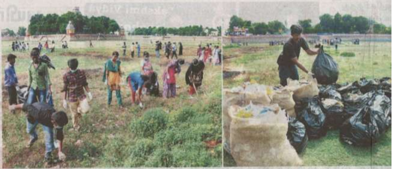
மதுரை தெப்பக்குளத்தில் குப்பைகளை சேகரிக்கும் கல்லூரி மாணவர்கள். அடுத்த படம்: மூடை மூடையாக சேர்ந்த குப்பைகள்.