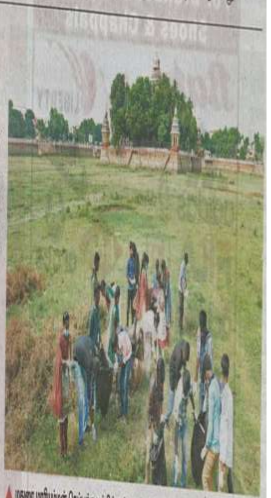
▲ மதுரை மாரியம்மன் தெப்பக்குளத்தில் தூய்மைப் பணியில் ஈடுபட்டுள்ள காமராஜர் பல்கலைக் கழகம், தியாகராஜர் கல்லூரி மாணவ, மாணவிகள்.