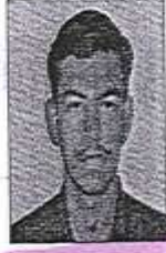
மா.செந்தில் குமார் தியாகராஜர் கல்லூரி, மதுரை