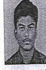
உ.சுதர்சன் காந்தி வேளாண் தொழில்நுட்பக் கல்லூரி, சேலி