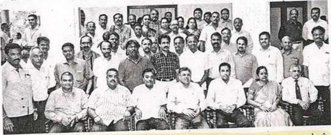
மதுரை தியாகராஜர் கல்லூரியில் 1985 - 2005 ம் ஆண்டு வரை படித்த மாணவர்கள் சந்தித்தனர்.