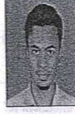
க.விக்னேஷ்வரன் மதுரை சூழக அறிவியல் கல்லூரி,